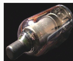
X射线管、真空管电源